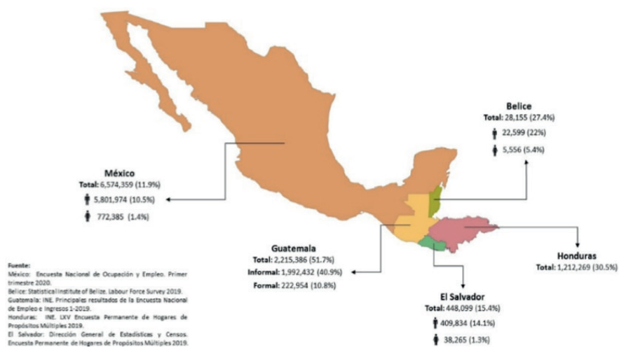
Cuadro 1. Población ocupada en el sector agropecuario

Al ubicar la fuerza laboral en el sector agrícola se infiere la importancia del sector primario en las respectivas economías. De acuerdo a los datos disponibles sobre la población ocupada en el sector agropecuario en esta región del total nacional: México reportó 12% 2 ; El Salvador 15% 3 ; Belice 27% 4 ; Honduras 31% 5 ; y Guatemala 52% 6 . Sobre estos mismos datos los porcentajes de la participación femenina son bajos en actividades primarias. Cuadro 1