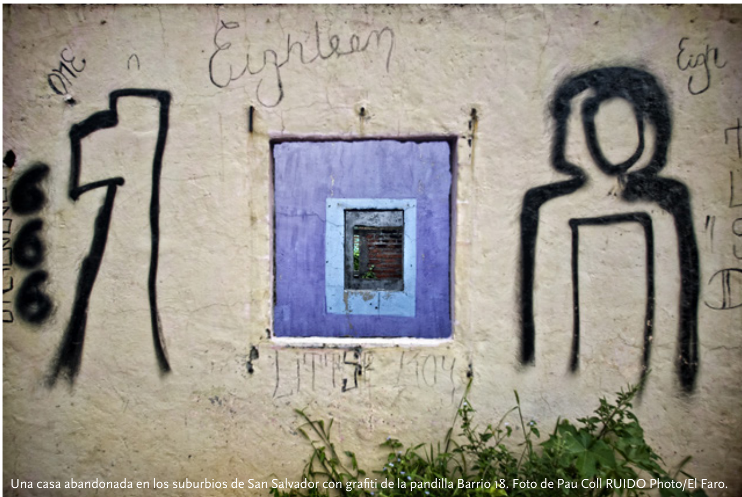
Una casa abandonada en los suburbios de San Salvador con grafiti de la pandilla Barrio 18.