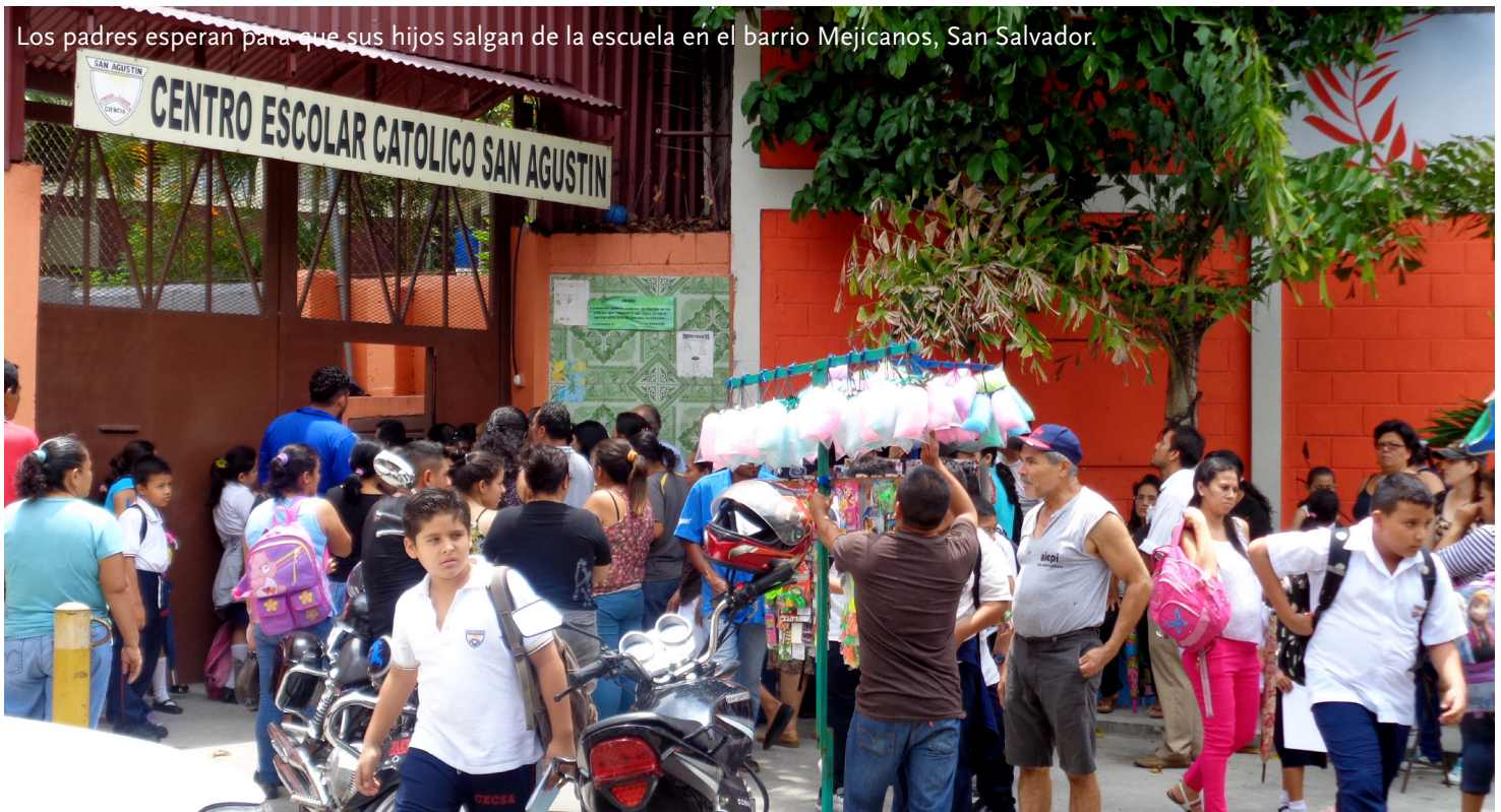
Los padres esperan para que sus hijos salgan de la escuela en el barrio Mejicanos, San Salvador.

Actualmente es muy difícil para las familias desplazadas identificar y pagar el alquiler de viviendas seguras dentro de El Salvador. Hasta