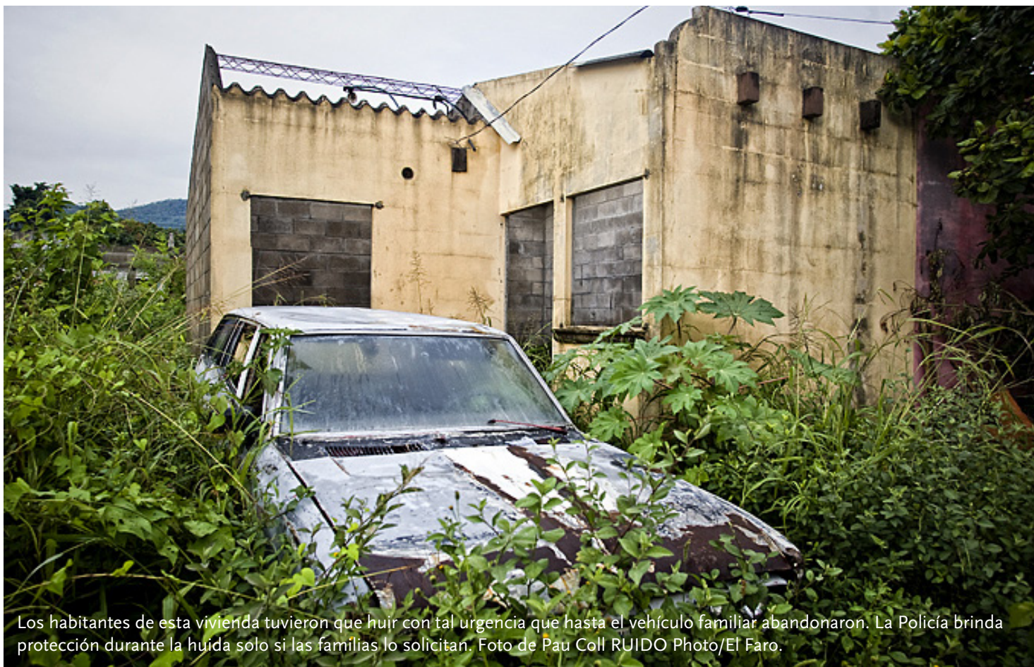
Los habitantes de esta vivienda tuvieron que huir con tal urgencia que hasta el vehículo familiar abandonaron. La Policía brinda protección durante la huida solo si las familias lo solicitan.

para salir del país. Allí la alentaron a que volviera a insistir con el gobierno para pedir ayuda porque, le explicaron: “a nuestro modo de ver, si ayudamos a las personas a salir del Estado sin activar al gobierno, éste tiene impunidad total y puede decir que el desplazamiento forzoso no existe”. La joven otra vez no recibió ayuda del gobierno, y actualmente está escondida (se desconoce si está dentro o fuera del país).