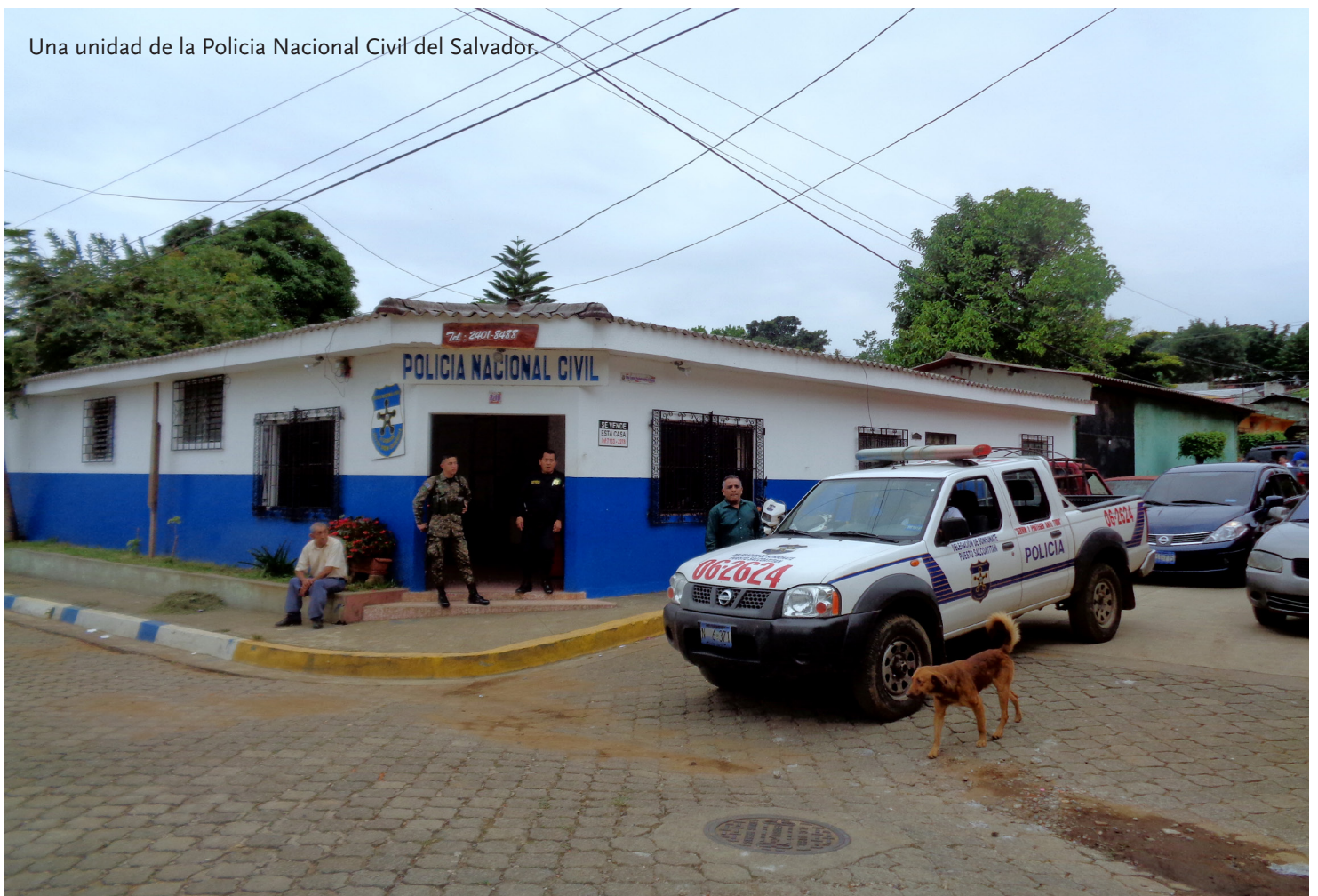
Una unidad de la Policía Nacional Civil del Salvador.

Este año, miles de salvadoreños solicitaron asilo u otra forma de protección complementaria en los Estados Unidos, México, Panamá, Nicaragua, Costa Rica, Suecia y otros países. Algunos piden seguridad incluso en Guatemala, otro país con elevados niveles de violencia pero también más espacio físico para absorber y esconder a las personas. Si bien la mayoría de las personas que solicitan asilo generalmente termina en los Estados Unidos, cuantos más salvadoreños logran recibir protección en otros países, es menos probable que intenten el peligroso viaje a través de México hacia los Estados Unidos. Una persona desplazada dijo a RI: “El objetivo final no es llegar a los Estados Unidos, sino salir de El Salvador”. Mientras tanto, los Estados Unidos y México deben estar mucho más atentos para garantizar que los salvadoreños que huyen de la persecución y otras violaciones de los derechos humanos tengan acceso a un oficial de asilo antes de ser deportados. De lo contrario, se estarían arriesgando a quebrantar el principio de no devolución, o el requisito de que nadie debe ser devuelto a un país donde existen graves violaciones de los derechos humanos.