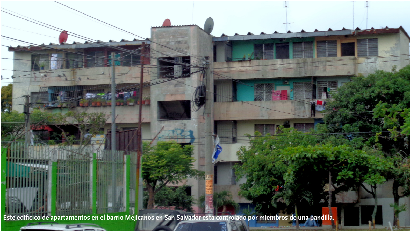
Este edificio de apartamentos en el barrio Mejicanos en San Salvador está controlado por miembros de una pandilla.

“ Antes las pandillas ubicaban a la gente y la amenazaban. Ahora simplemente la matan. ”