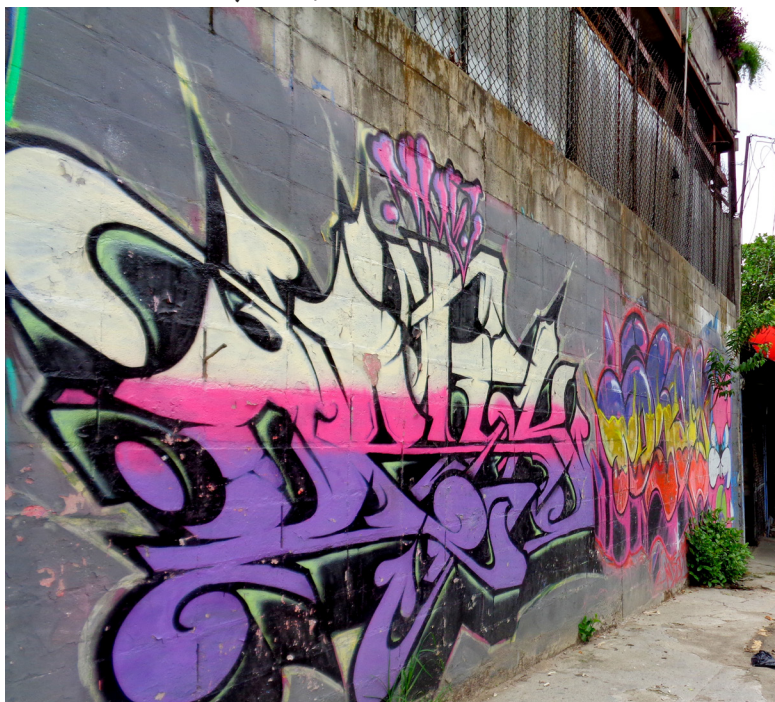
irafti en el barrio Mejicanos, San Salvador.

Cada una de estas situaciones representa una crisis para una familia y una emergencia para las OSC, que intentan dar apoyo a las familias desplazadas porque el gobierno no se los brinda. El gobierno debe reconocer públicamente que las pandillas y algunos miembros de la policía y el ejército son los causantes del desplazamiento interno y externo de personas en El Salvador, y comprometerse a desarrollar e implementar una respuesta humanitaria. También debería agregar preguntas específicas al censo nacional del 2017 que faciliten la recopilación de datos sobre cuántas personas han huido de sus hogares debido a la violencia, dónde han sido reubicadas y cuál es el perfil demográfico de sus hogares.