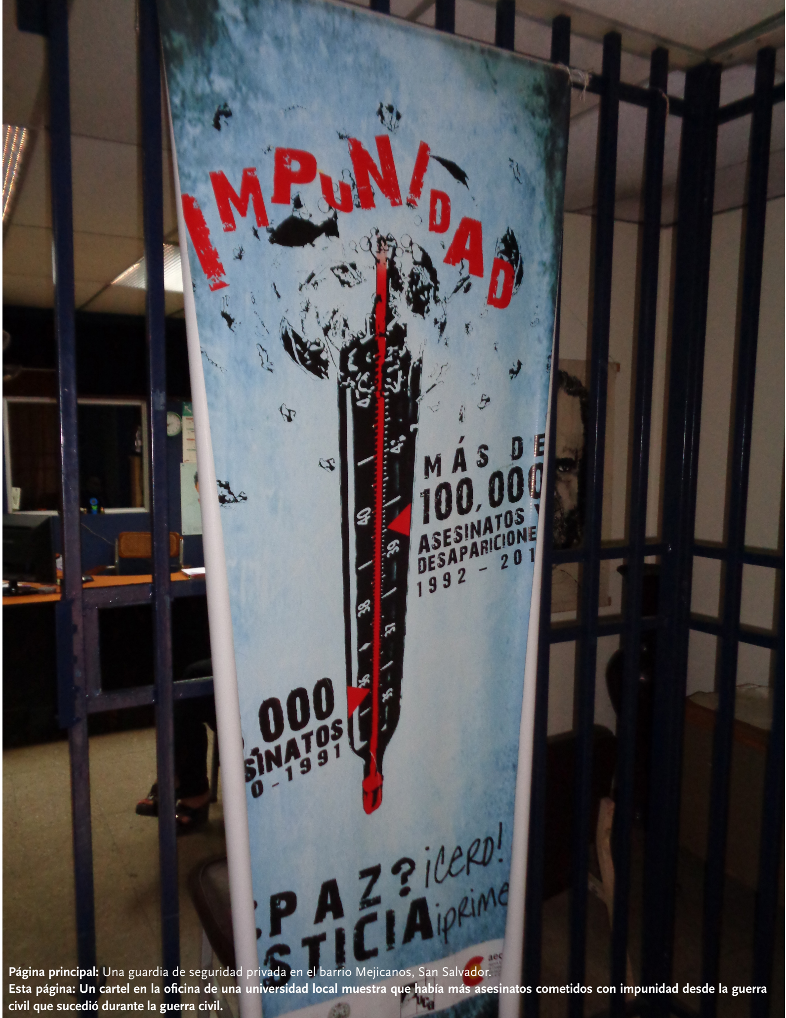
Página principal: Una guardia de seguridad privada en el barrio Mejicanos, San Salvador. Esta página: Un cartel en la oficina de una universidad local muestra que había más asesinatos cometidos con impunidad desde la guerra civil que sucedió durante la guerra civil.